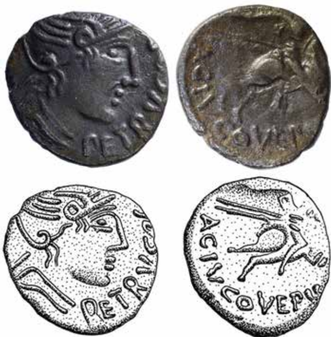
Vallée du Rhône, quinaire au cavalier à la légende PETRVCOR/ACIVCOVEPVS, dès 120 av. J.-C.

Certaines monnaies, comme à Sermuz (près d'Yverdon-les-Bains), ont été retrouvées sur des sites que l'on soupçonne être des camps militaires utilisés pendant et après la conquête pour contrôler le territoire helvète.