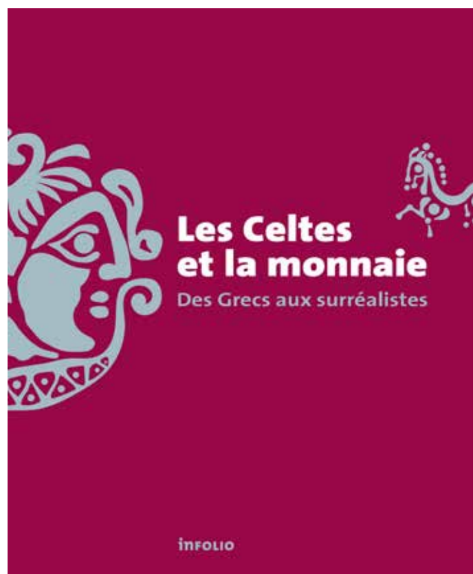
Page de couverture du catalogue. Edité par Infolio (Gollion), imprimé en Suisse. Prix de vente 35 CHF.

Réalisé sous la direction des commissaires de l'exposition et rédigé par les meilleurs spécialistes de la question (33 auteurs), cet ouvrage (168 pages, entièrement en couleur) a pour dessein d'expliquer à un large public l'apparition de la monnaie chez les Gaulois et son évolution à travers les siècles. Influencés d'abord par les modèles grecs puis romains, les Celtes ont su exprimer l'intensité et la complexité d'un art unique sur leurs pièces. Les surréalistes, et notamment André Breton, nourrissent une véritable fascination pour cette iconographie monétaire gauloise qu'ils découvrent dans les années 1950. Afin de mettre en lumière ces œuvres d'art méconnues, l'ouvrage s'articule en cinq parties, comme autant de temps forts qui ont rythmé l'histoire du monnayage en Gaule et sur le Plateau suisse.