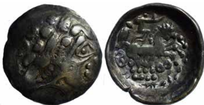
Statère au rameau et au 8 couché de Vufflens-la-Ville.

Pour refléter cet essor monétaire, le scénographe Arno Poroli a imaginé un dispositif de « pluie de monnaies » constitué de plus de 17 000 petites médailles suspendues. L'installation a été réalisée par les Ateliers du colonel à Lausanne.