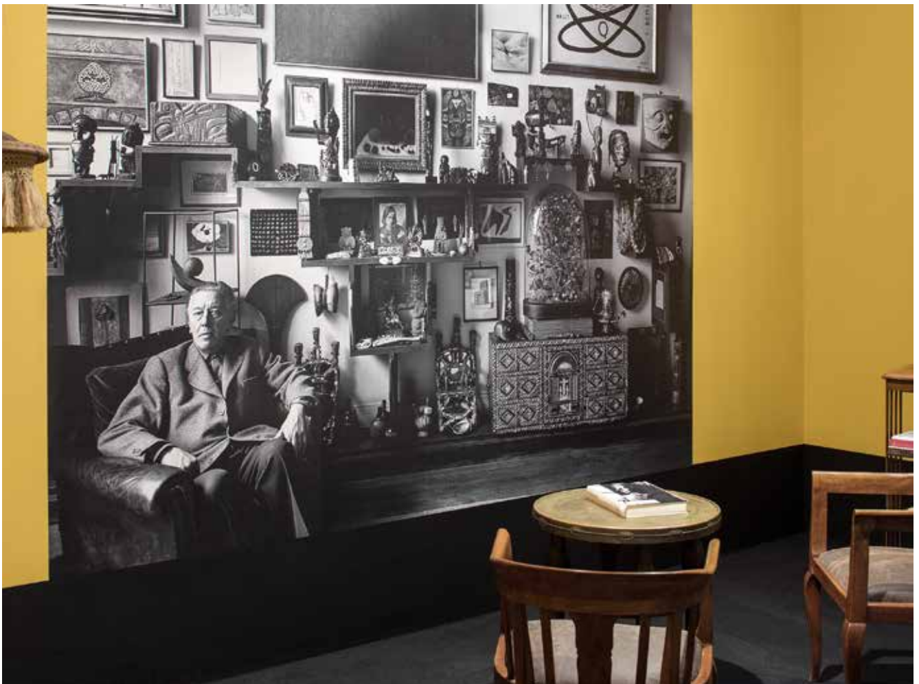
Vues de l'exposition