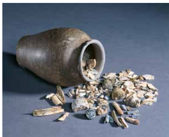
Tombe à crémation de Saint-Sulpice (Vaud).

À Lausanne, Vevey, Sion et Berne, plusieurs tombes de femmes celtiques contenant des monnaies sont découvertes dès la fin du 19 e siècle. La plus ancienne, à Vevey, remonte à 220 avant J.-C. Celles de Lausanne, Berne et Sion datent des années 150 avant J.-C.