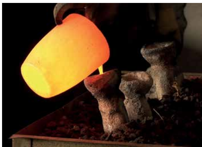
Moules, creuset et métal en fusion. Extrait du film réalisé par David Geoffroy, Court-Jus production. Comité scientifique : Julia Genechesi, Lionel Pernet et Katherine Gruel (CNRS).

Cette section présente une reconstitution d'un atelier de frappe de monnaie et des maquettes, ainsi qu'un film produit spécialement pour l'exposition et traitant de la fabrication des monnaies celtiques.