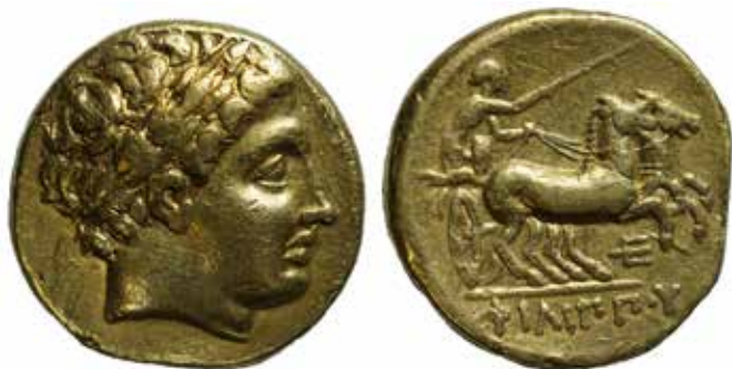
Statère posthume de Philippe II de Macédoine en or. De nombreuses monnaies celtiques imitent ces frappes grecques. 323-317 av. J.-C.