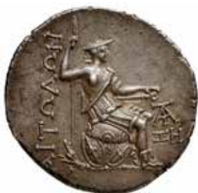
Tétradrachme en argent avec un motif de trophée : l'Étolie vainqueur est assise sur un amas de boucliers celtiques et un carynx (trompette celtique). Ligue étolienne. 239-229 av. J.-C.

Dans cette partie de l'exposition, les visiteurs peuvent manipuler un bouclier et une épée celtiques, à proximité du moulage du Gaulois mourant du Capitole prêté par la Skulpturhalle de Bâle. Ils peuvent également contempler les objets découverts dans des tombes de guerriers d'Ensérune (Hérault, Musée et site archéologique de l'oppidum d'Ensérune, Centre des Monuments nationaux).