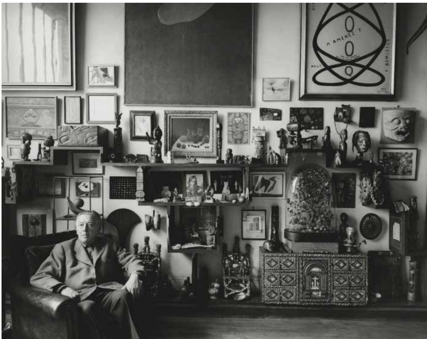
André Breton, dans son atelier, rue Fontaine, Paris, 1956.

Deux précieux cahiers brochés, vert et rose (recouverts de papier cristal) constituant le catalogue de la collection de monnaies gauloises d'André Breton : toutes les monnaies sont illustrées par des frottages au crayon sur papier bleu très fin et les descriptions sont de sa main. Prêt de la Bibliothèque nationale de France, Paris.