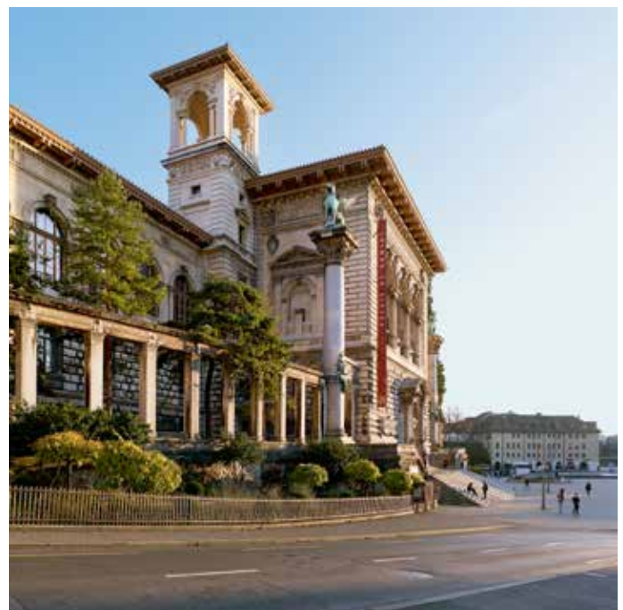
Palais de Rumine.

Grâce à la médiation culturelle, le MMC a pour but de faire connaître les collections par le biais des expositions et des animations afin d'assurer le rayonnement de l'institution sur le plan national et international.