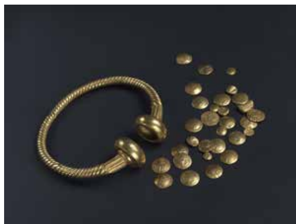
Le trésor de Tayac, torque et monnaies en or. © Mairie de Bordeaux, Musée d'Aquitaine. Photo L. Gauthier.